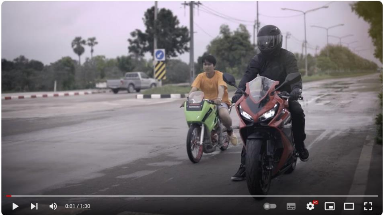
ความเร็วใช้ให้ถูกที่

https://www.youtube.com/watch?v=y6gucVvKSLk